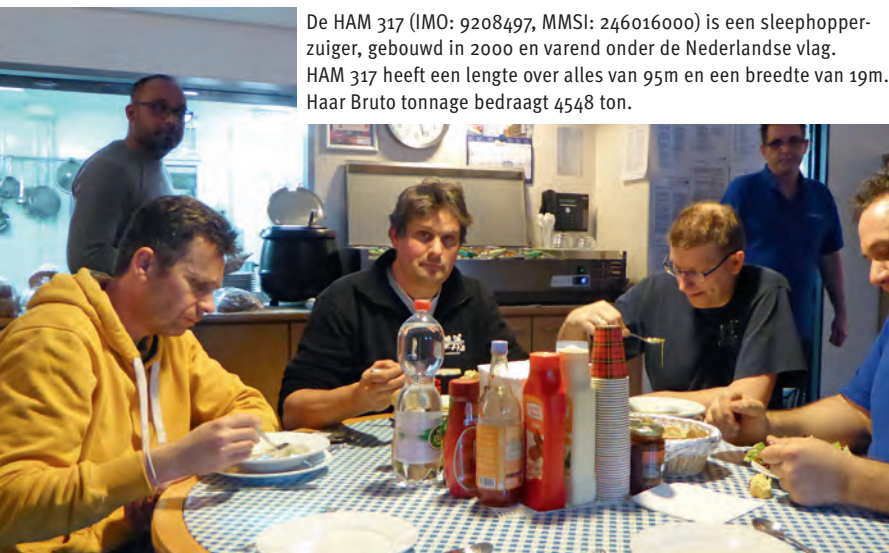
De HAM 317 (IMO: 9208497, MMSI: 246016000) is een sleephopperzuiger, gebouwd in 2000 en varende onder de Nederlandse vlag. HAM 317 heeft een lengte over alles van 95m en een breedte van 19m. Haar Bruto tonnage bedraagt 4548 ton.

In de publieke opinie zie je ook steeds meer dat met name jongeren steeds minder geven om 'louter winstgerichtheid' van ondernemingen. Werkzekerheid en je kunnen ontwikkelen staat voor hen steeds meer voorop. Ook wordt er volstrekt anders gekeken naar het flexibel maken van arbeid. Ondernemingen die blijven doorgaan met het afstoten van hun vaste werknemers en niet ophouden met het outsourcen van werk, zijn inmiddels verdacht. En moeten daar wel hele goede redenen voor hebben. 'Moderne ondernemingen doen dat niet meer', is de overtuiging. Ik ben dan ook zeer benieuwd hoe modern de Waterbouw werkgevers willen zijn! ⚡