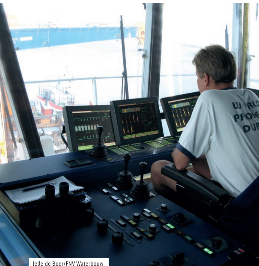
Jelle de Boer/FNV Waterbouw

Als je werkzaam bent in de sector Waterbouw, aan de voorwaarden voldoet en geboren bent tussen 1955 en 30 september 1961 dan kun je tot en met december 2025 gebruik maken van de RVU-regeling Waterbouw. Vanuit de stichting RVU Waterbouw ontvangen deelnemers maandelijks een uitkering die kan doorlopen tot uiterlijk december 2028. Deze uitkering kunnen deelnemers waar mogelijk zelf aanvullen door het naar voren halen van opgebouwd pensioen of vanuit spaartegoeden.